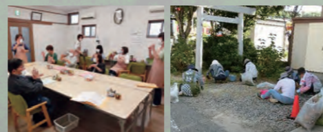
高齢者サロン『すずめのいえ』