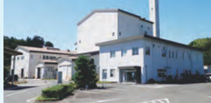
資源ごみを処理するリサイクルプラザ。