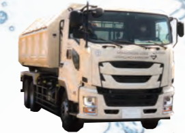
ごみ収集運搬業務