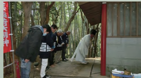
浦戸大澤稲荷大祭