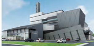
知多南部広域環境組合のごみ処理施設。