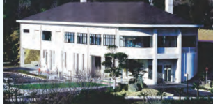
知多南部衛生組合のし尿処理施設。