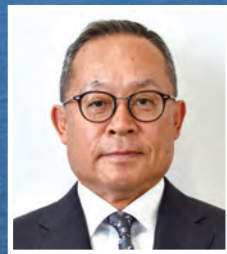
みはまふるさとまつり実行委員会 実行委員長