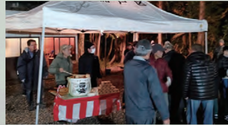
年末年始 壬生神社振舞い酒

③ボランティア活動も活発に行っており、主に壬生神社、大澤稲荷、称名寺(お墓)、憩いの家などの除草作業を1回/月行っており美化活動を推進しております。