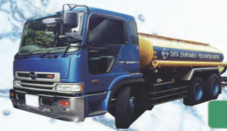
一般・産廃収集運搬業務