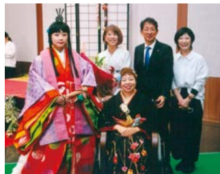
▲開催後の集合写真