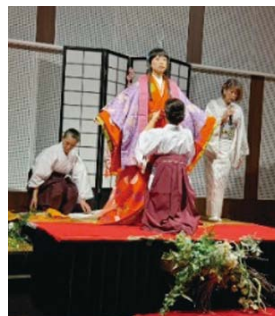
▲十二単の着付けの様子