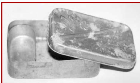
昭和20年頃(横16cm×横10cm×高さ4cm)

昭和38年にアメリカより、「タッパーウェア」というプラスチック製の密閉容器で、完全に蓋が密封でき汁漏れしない製品が入ってきました。この画期的製品が進化して、プラスチック製の弁当箱が登場し、現代も使い続けられています。