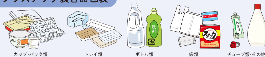
カップ・パック類