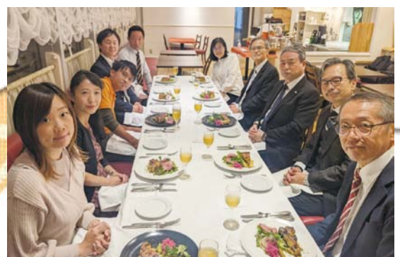
▲懇親会の集合写真

今回の講座を通して、美浜町の重要な分野の一つである農業を多くの人々に紹介することができました。今年も、美浜町の魅力を色々な場面で伝えていければと思います。