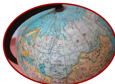
ソビエト連邦(略称)