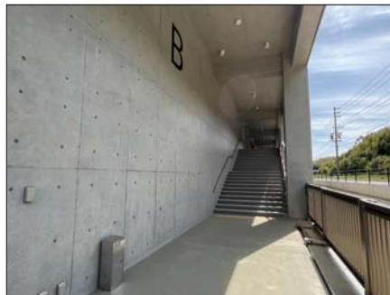
観覧席へはここから入ります。Aゲート、Bゲートの計2か所あります。