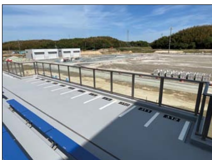
観覧席の最前部に、計12席の車いす専用観覧席を設置しています。