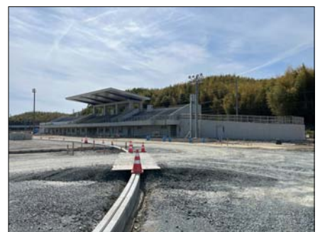
フィールド側から見た観覧スタンドの様子です。フィールド（写真手前）の工事が進んでいます。