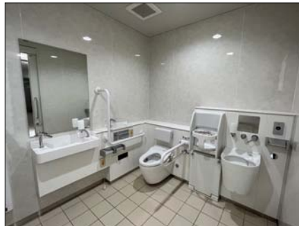
男性用1か所、女性用1か所、共用3か所の計5か所設置しています。