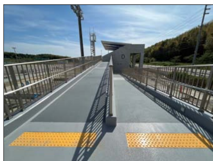
観覧席へはスロープからも行くことができます。傾斜が緩やかなので、車いすなどでも利用できます。