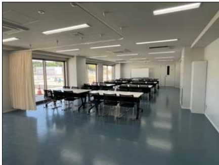
選手や大会役員などの控室です。集会・クラブ活動などでも利用できます。カーテンを仕切ると医務室としても利用できます。