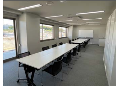
大会役員や大会記録などが集まる部屋です。打合せなどでも利用できます。