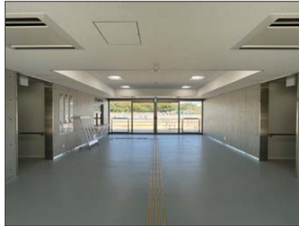
正面玄関から入って左側奥が受付カウンター、正面奥が陸上競技場のフィールドです。