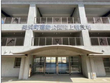
陸上競技場（フィールド）へはここから入ります。