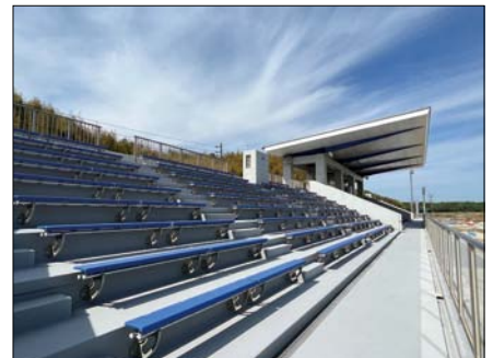
計986席の観覧席を設置しています。中央部には屋根があります。