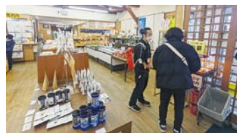
▲スポット2に到着 西グループ「食と健康の館」 東グループ「魚太郎」