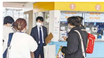
▲スポット1に到着 西グループ「南知多ビーチランド」、 東グループ「ジョイフルファーム」