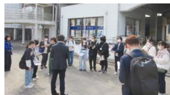
▲知多奥田駅で集合。「西海岸エリア」と「東海岸エリア」の2つのグループ分け