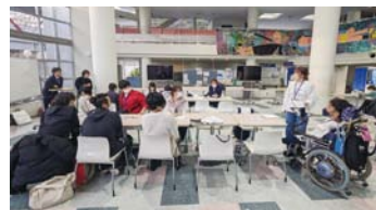
▲日本福祉大学で意見交換