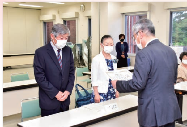
▲金婚を迎えられるご夫婦へ美浜町社会福祉協議会会長から贈呈