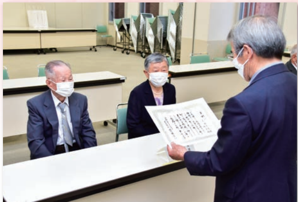
▲ダイヤモンド婚を迎えられるご夫婦へ町長から贈呈

6月25日(金)、美浜町生涯学習センターで、第10回ダイヤモンド婚・第38回金婚を祝う会を開催しました。 対象ご夫婦へ、記念品贈呈と記念写真撮影を実施しました。 今回対象のご夫婦は、ダイヤモンド婚20組・金婚38組です。 これからも仲むつまじくお幸せに。