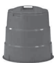
たい肥化容器の例