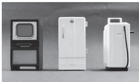
The KADEN collection (ミニチュアモデル) Panasonic Museum製

「電気洗濯機」は、三種の神器の中で最も早い時期から売れ始めました。それ以前の洗濯は、たらいとせんたく板をする主婦の重労働の1つでした。電気洗濯機の登場で洗濯に費やす時間を減らすことができました。