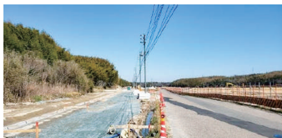
左側:新しい道路 右側:現在の道路

付け替わる時期は、8月下旬を予定しています。工事に際しては、通行止めなど近隣を通行される方にご不便をおかけしておりますが、引き続きご協力をよろしくお願いいたします。