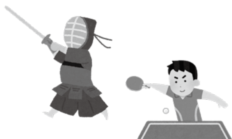
令和3年度 美浜町スポーツ少年団活動団体一覧表

入団を希望される方、ご興味のある方は美浜町スポーツ少年団本部事務局（総合公園体育館内）まで、お問い合わせください。