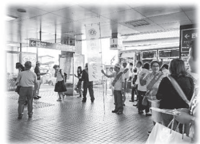
▲薬物乱用撲滅キャンペーンの様子 (河和駅前にて)