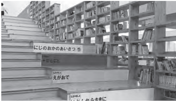
県内産木材を使用し建設された瀬戸市立にじの丘学園

校施設環境改善交付金や環境省の二酸化炭素抑制対策補助金や林野庁の林業・木材産業対策補助金など、施設整備や防災機能強化、学校給食施設、太陽光発電、県内産木材使用支援などあらゆる補助金・交付金を活用して町の負担が少しでも軽減できるよう情報収集・調査研究していきます。