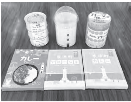
新たに試作中の特産品

産業課長 妙高市は、本町が目指すスポーツ合宿等で経済効果が非常に高く、成功している先進地であり、運動公園の合宿の視察に伺ったご縁で交流が始まり、お互いの特産品を持ち寄り、7月29、30日に妙高市で美浜町の物産展を、