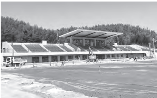
陸上競技場スタンド

令和3年度からの繰り越し事業として実施していた主に陸上競技場のスタンド建設工事に関する事業の費用が確定したためです。 変更金額 9億1032万510円 (910万2390円減額)