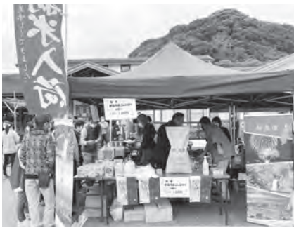
新潟県妙高市物産展（食と健康の館にて）

町長 現在すでにある特産品の改良も進めながら、地元の資源を活用し、備蓄用の缶詰等、新たな特産品の開発に取り組む、「美浜町地域ブランド化推進協議会」での、新商品の開発、物販、PRを進めていきます。