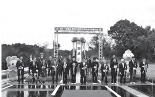
一般県道奥田内福寺南知多線開通式