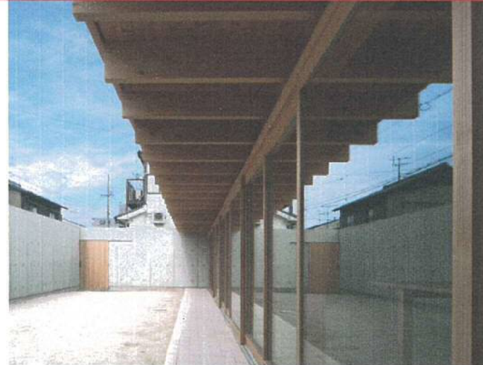
実作例2 開放的な開口とマッチした現しの柱・梁で美しく住み良い家

断熱 ：調湿性、吸音性の高い天然木100%の断熱材、Low-e ガラスを使用して環境負荷の低減を目指します。