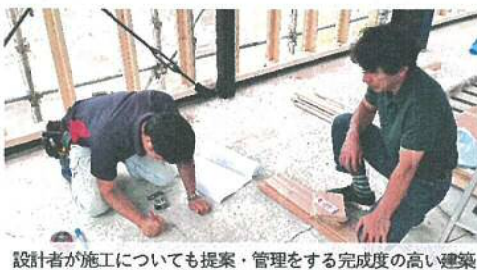
設計者が施工についても提案・管理をする完成度の高い建築

職人の成果・モチベーションを高める提案 職人の力量が問われる在来工法の「質の求められる仕事」よっての職人の技術力・プライドを育みます。具体的には蓄積された経験をいかし設計者が施工図や原寸図をかりて提案をすることで、設計者側も意見交換にとどめるのではなく、さまざまな分野の職人に対しても互いに責任を持てる環境をつくり、質の高い建築を実現します。