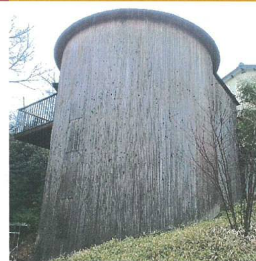
実作例3 経年変化により周辺の風景と馴染んでいる

住人自治とLCCの削減 各住戸の樹木はその住人が世話をするため明快な区分により管理を容易にしています。また、住民に対してメンテナンス方法のワークショップなどを行うことにより各々で責任を持ち管理し愛着のわく場所となると考えます。