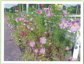
4 美浜 IC コスモス