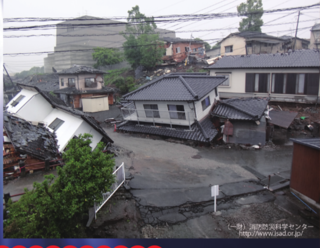
2016年 熊本地震による家屋の被害状況